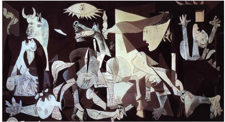
Pablo Picasso- Guernica