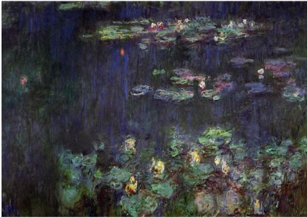
Claude Monet - "Nuferi, Reflexie Verde"(jumătatea dreaptă)

În funcție de modul de alcătuire a elementelor de limbaj plastic se diferențiază două feluri de compoziții: compoziția plastică și compoziția decorativă.