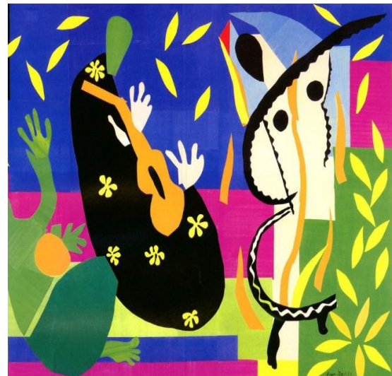
Henry Matisse-Tristețea regelui