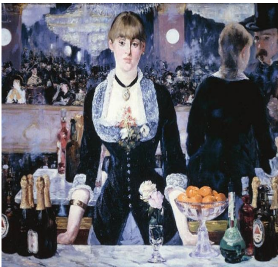
E. Manet - „Bar la Folies-Bergere